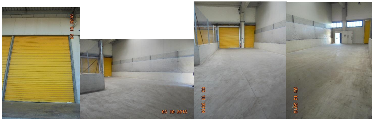
FOTO MAGAZZINO ED. 07 1C