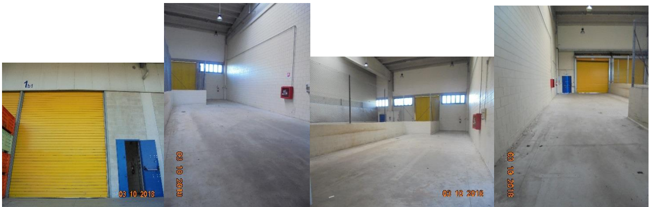
FOTO MAGAZZINO ED. 07 1B1